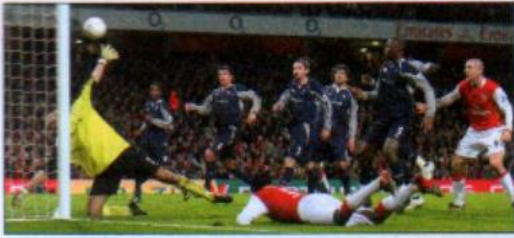
1 a sports programme