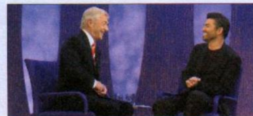
12 a chat show