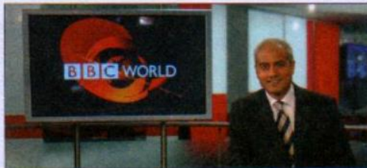
5 the news