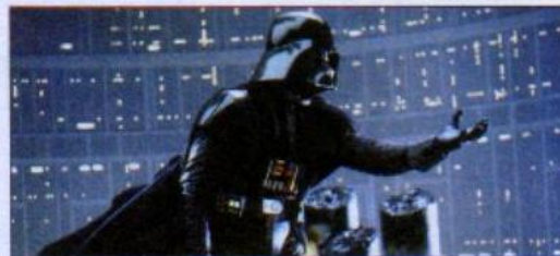
9 a film/movie