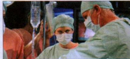
8 a hospital drama