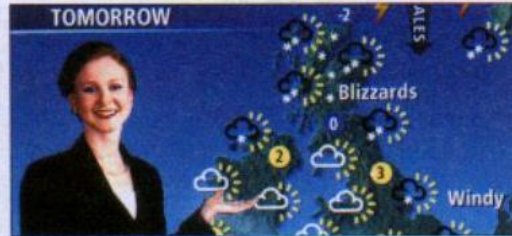
6 the weather forecast