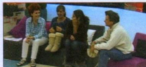
11 a reality TV show