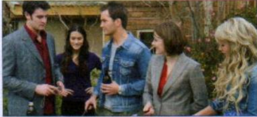
3 a soap (opera)