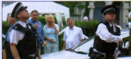
7 a police drama