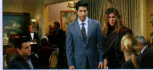
4 a sitcom