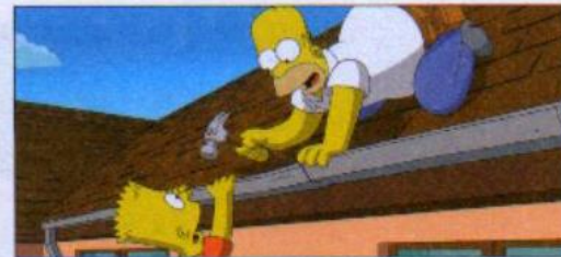
10 a cartoon