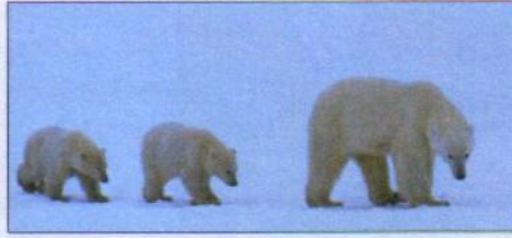
2 a documentary